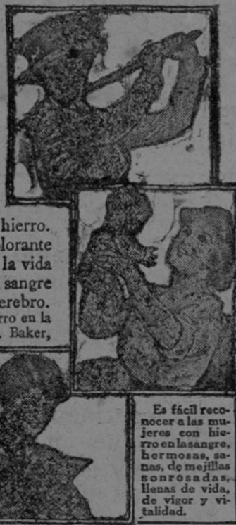
Es fácil reconocer a las mujeres con Hierro en la sangre, hermosas, sanas, de mejillas sonrosadas, llenas de vida, de vigor y vitalidad.